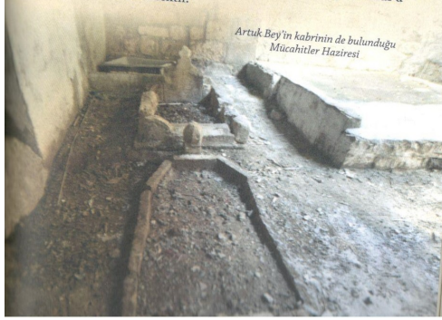
Resim 06.2. Artuk Bey'in kabrinin de bulunduğu Mücahitler Haziresi 10

Kaynaklar Artuk'un akıllı, kudretli ve kahraman bir insan olduğunu yazar. İbn-ül-Esirde Artuk'un hiçbir savaştan mağlubiyet görmediğini söylemektedir. 11